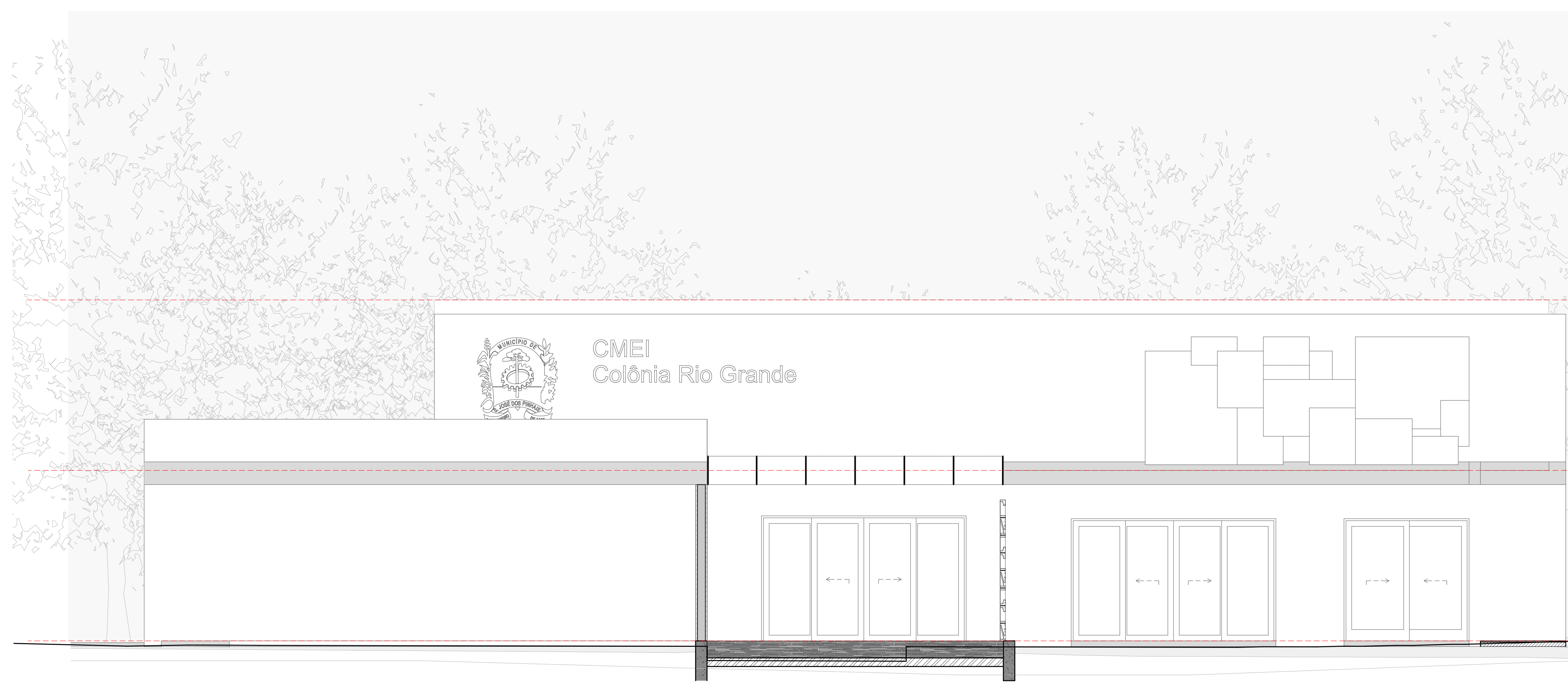
Elevação 1 Escala: 1:50