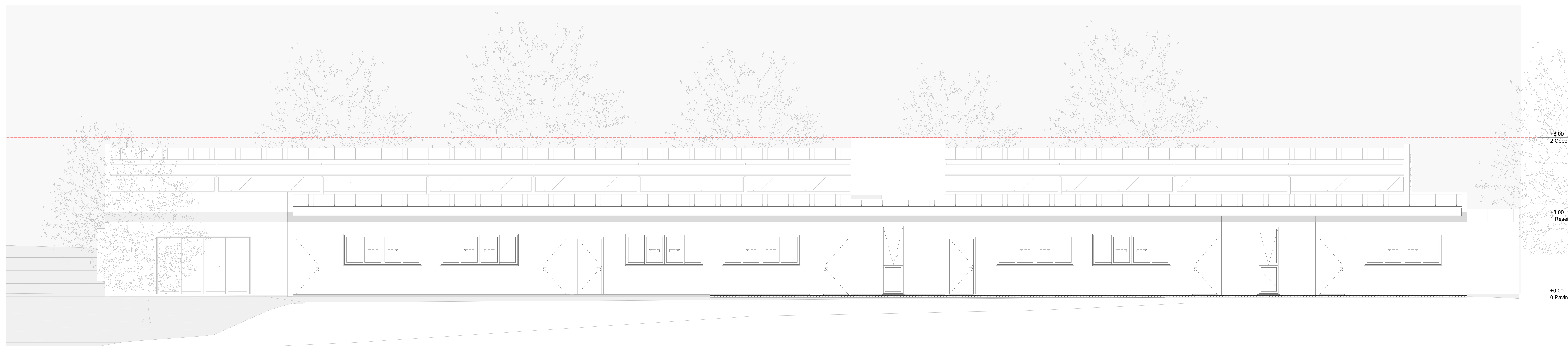
Elevação 4 Escala: 1:50

INFORMAÇÕES PROPRIETÁRIO: MUNICÍPIO DE SÃO JOSÉ DOS PINHAIS ENDEREÇO COMPLETO: RUA PASSOS DE OLIVEIRA 1101 - CEP: 83030-720 CNPJ: 76.105.543/0001-35 AUTOR DO PROJETO: EMANUEL H. FONTES DE MENDONÇA / CAU-PR A286.579-3 USO DA EDIFICAÇÃO: COMUNITÁRIO 2 - CMEI PADRE JOSÉ DE ANCHIETA - 01 PAVIMENTO INDICAÇÃO FISCAL: 10.950.0008.0000 MATRÍCULA: 03.336 - 2º OFÍCIO ÁREA DO TERRENO: 16.025,57 m²