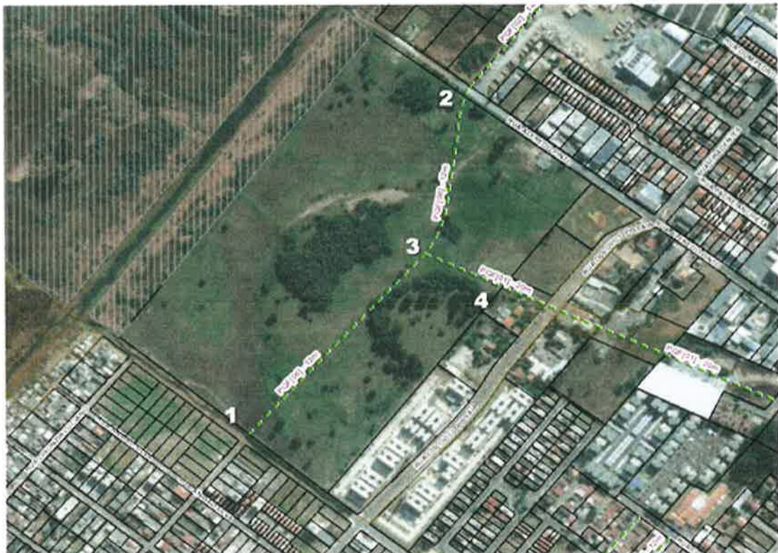
Figura 1 - Diretrizes viárias