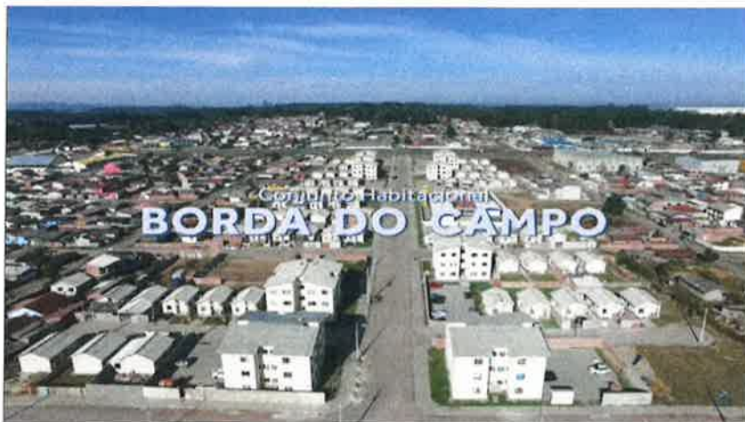
Foto: vista aérea dos Residencial Borda do Campo I (casas) e Borda do Campo II (apartamentos)

Em 2021, foi dada continuidade pela Secretaria Municipal de Habitação do processo de revalidação anual dos Contratos de Concessão de Direito Real de Uso, referente aos imóveis do Residencial Borda do Campo I e II, e os beneficiários apresentaram os comprovantes atualizados das contas de água, energia elétrica, adimplência do condomínio (no caso do Residencial Borda do Campo II), bem como da formalização do seguro residencial.