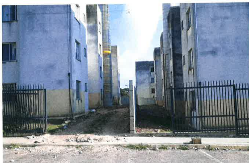
Fotos das obras do desmembramento dos Residenciais Serra do Mar I e II

Em 2021, deu-se continuidade às obras de readequação dos Residenciais, com a pintura dos prédios e casas, início da instalação dos reservatórios de água, finalização dos muros e gradis, e demais serviços.