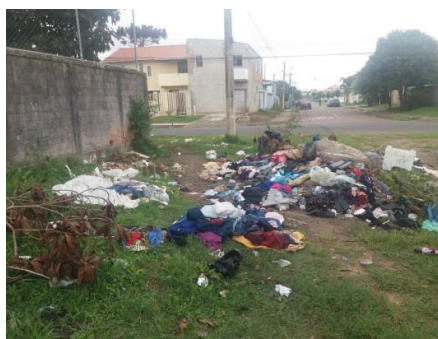
Imagens de pontos de desova e poluição ambiental